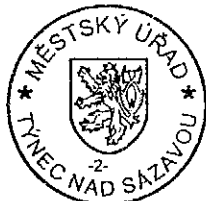
Lenka Ottová zástupce vedoucího odboru výstavby

Rozhodnutí má podle § 93 odst. 1 stavebního zákona platnost 2 roky. Podmínky rozhodnutí o umístění stavby platí po dobu trvání stavby či zařízení, nedošlo-li z povahy věci k jejich konzumaci.