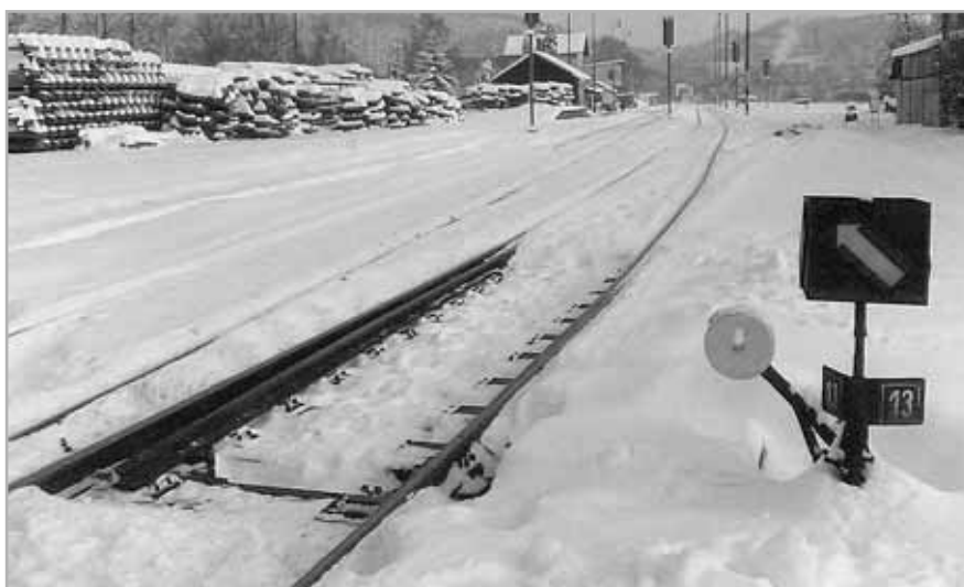
Zima v Týnci

v pátek 31. března 2011 – termín uzávěrky je závazný!