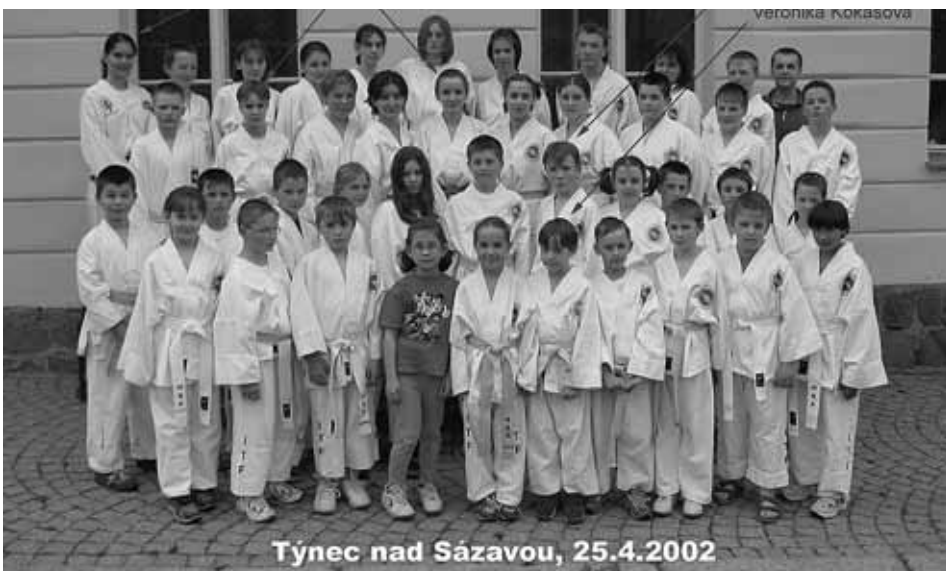
Týnec nad Sázavou, 25.4.2002