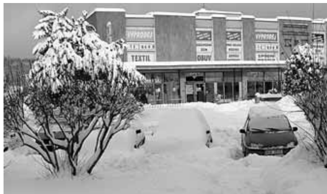
Zima v Týnci

JIŘÍ NEDRA 603 295 994, jiri.nedra@tiscali.cz