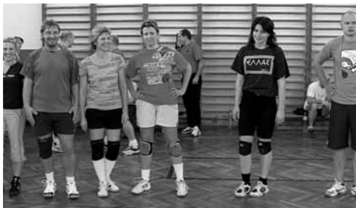
Týnec II. - vítězové celého turnaje