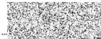
za příjemce Bohuslava Zemanová ředitelka Posázaví o.p.s.

POSÁZAVÍ o.p.s. IČ 27120772 DIČ CZ27120772 Zemské náměstí 1, Posázaví